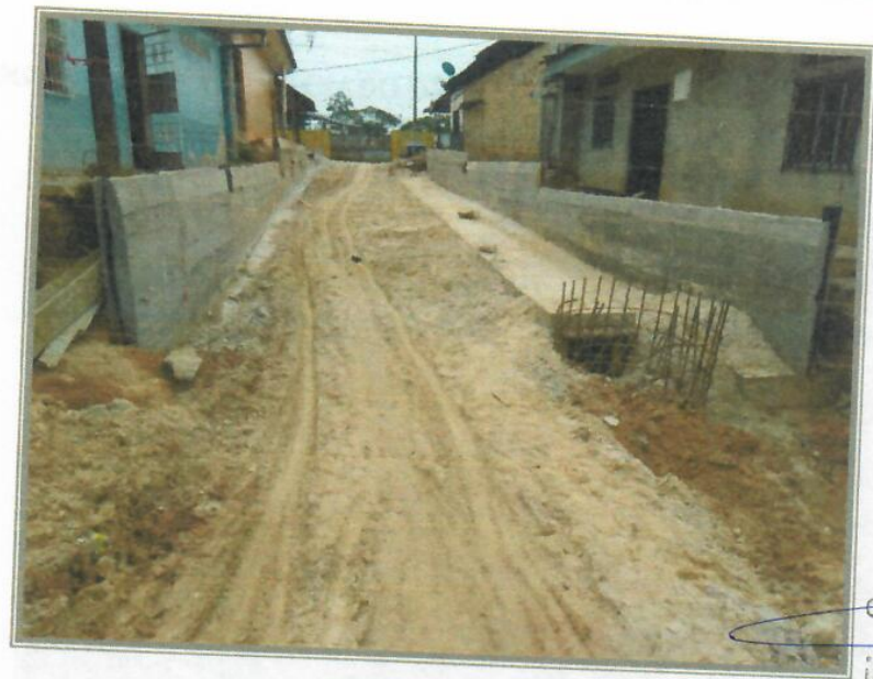
VISTA FOTOGRÁFICA N° 09 – CONFORMACION DE SUB RASANTE CA. AMERICA