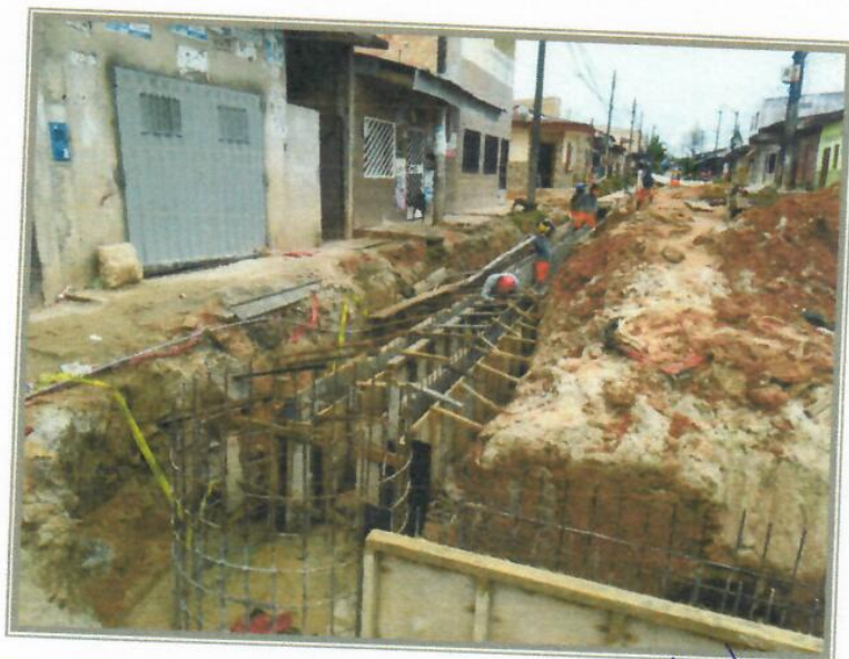
VISTA FOTOGRÁFICA N° 02 – ENCOFRADO DE MURO DE CANAL JR. CASTAÑA

[Signature] VICTOR DA SILVA DEL AGUILA INGENIERO CIVIL CIP 146160