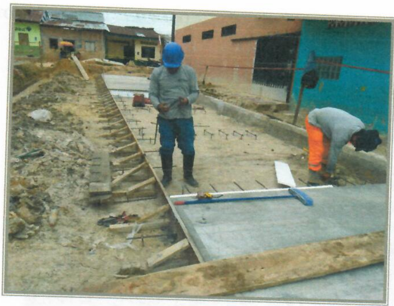
VISTA FOTOGRÁFICA N° 10 – VACEADO DE LOSA DE ROADURA EN CALLE LAGUNAS