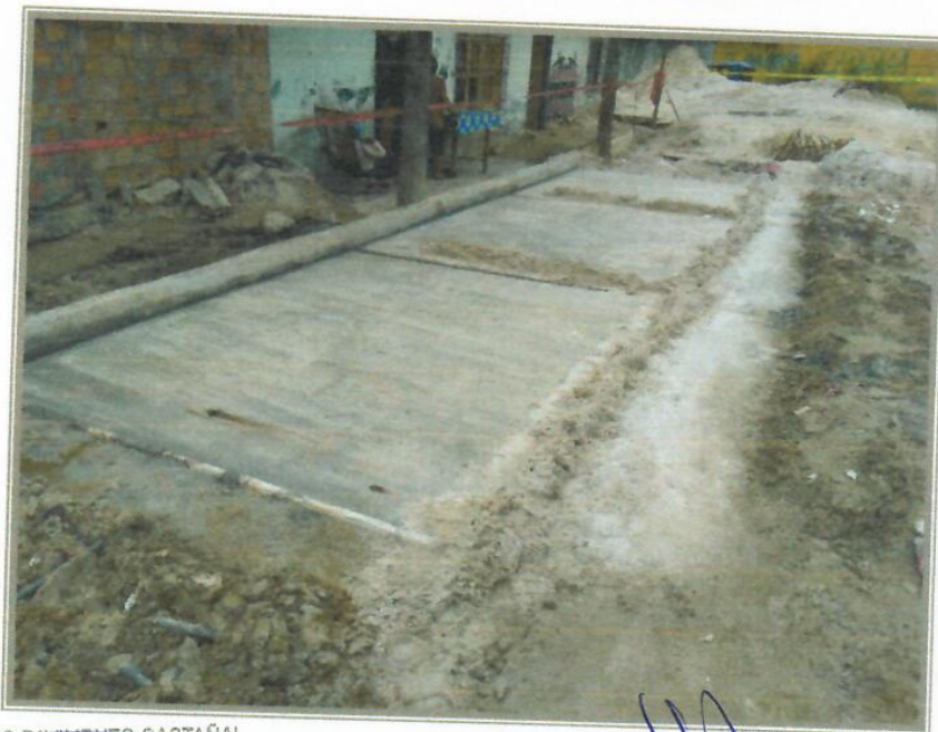
VISTA FOTOGRÁFICA N° 08 – LOSA DE RODADURA CALLE JUNIN

CONSORCIO PAVIMENTO CASTAÑAL ING. JANIO ZAPATA TAVARA RESIDENTE DE OBRA CIP N° 52247