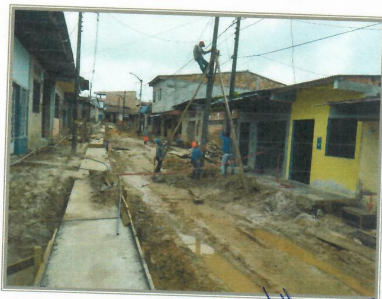
VISTA FOTOGRÁFICA N° 04 – LOSA DE SUPERIOR DE CANAL PSJ CASTAÑO

V.B. VICTOR DA SILVA DEL AGUILA INGENIERO CIVIL CIP 146160