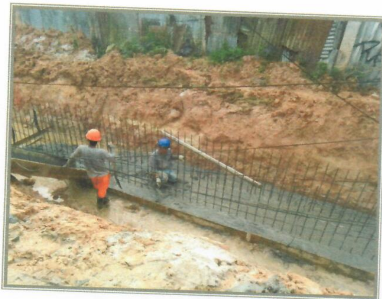
VISTA FOTOGRÁFICA N° 03 – VACEADO DE LOSA FONDO DE CANAL PSJ LAGUNAS