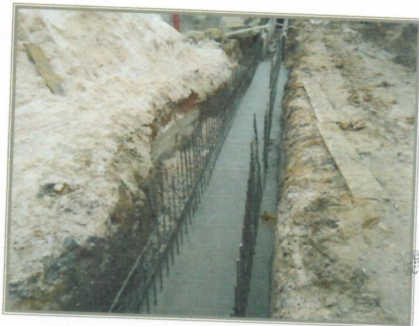
VISTA FOTOGRÁFICA N° 07 – LOSA DE FONDE DE CANAL PSJ. CASTAÑO

[Signature] ING. VICTOR DA SILVA DEL AGUILA INGENIERO CIVIL CIP 446160